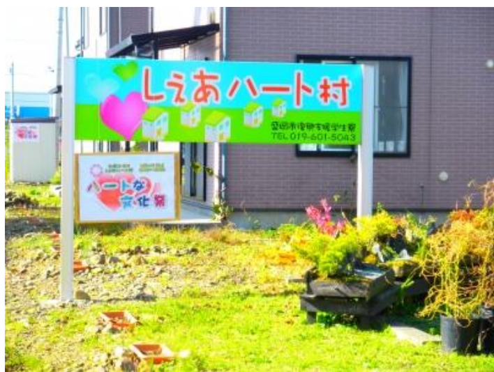
▲いつもの看板もこの日はちょっと違ったよ

しえあハート村では、夏に引き続き2回目のお祭り。今回は文化祭という事で、映画や手作りアート、ゲーム、クイズラリーなどなどたくさんの催しが行われました。はじめは寒い事もあり人も鈍かったのですが、お昼近くなると賑わいを見せ子供達のはしゃぐ姿も多々見られ嬉しく思いました。