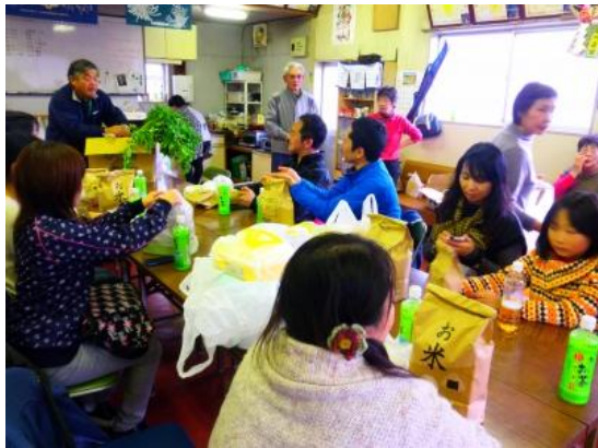
▲おみやげたくさん、ありがとうございました！

お昼には、川井の皆さんに作っていただいた、穴子（現地でいうハモ）の煮つけや味噌汁、お漬物をいただきました。川井でよく食べられているという穴子の煮付けは、私たちは始めて食べる人が多かったのですが、骨までやわらかく、おかわりもして食べました！