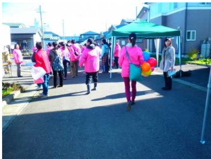
▲ゆいっこともたくさんお手伝いさせていただきました